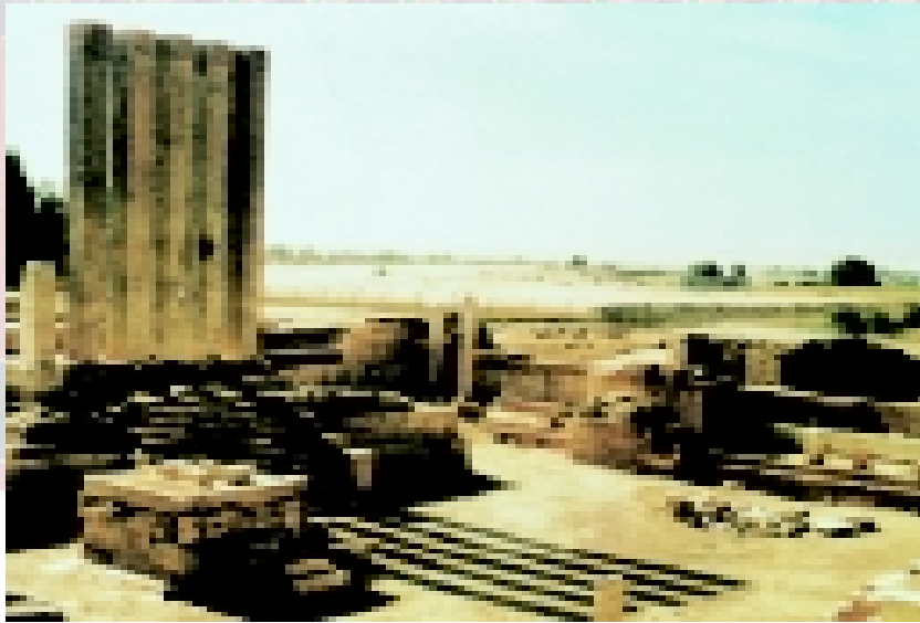
آثار سبأ في مأرب باليمن

كما ورد ذكر سبأ في القرآن الكريم وعند الإخباريين العرب. أما المؤرخون اليونان والرومان فقد كتبوا عن أخبار السبئيين واستقوا معلوماتهم من التجار الذين كانوا يذهبون إلى أسواق اليمن. وقد عرّف هؤلاء المؤرخون دولة سبأ على أنها دولة ذات شهرة تجارية واسعة عملت على تصدير منتجات جنوب الجزيرة العربية من الطيب واللبان والعود والمعادن النفيسة، بالإضافة إلى تجارة الهند من التوابل والعاج والأقمشة الحريرية.