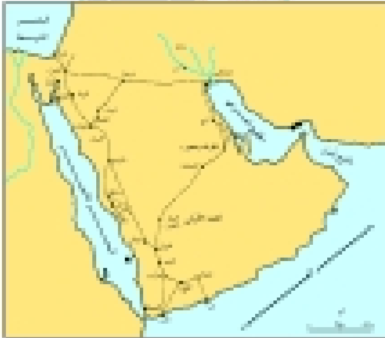
الممالك العربية الوسيطة وطرق التجارة القديمة

وأكثرهم نفوذاً الحارث الثالث (٨٧-٦٢ ق.م) لاقتران حكمه بالسياسة التوسعية التي بدأت باستيلائه على دمشق بعد أن عانت من الحروب اليونانية الداخلية، كما سيطر على سهل البقاع . وقد فرضت الظروف السياسية على الحارث الثالث التدخل في شؤون اليهود أكثر من مرة، كان أولها معركة حديدة إلى الشرق من يافا، حيث حقق الجيش النبطي انتصاراً ساحقاً على اليهود . أما المرة الثانية لتدخله فكانت عندما تنازع ولدا إسكندر خبايوس (أرسطوبولس وهركانوس) زعامة اليهود، إذ أعد الحارث جيشاً قوامه خمسون ألف