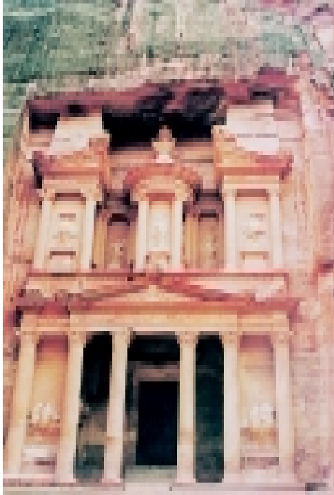
نموذج للعمارة النبطية - البتراء

والتوابل . إلا أن الحملة باءت بالفشل الذريع عندما هاجم الأنباط الغزاة أثناء رجوعهم ليلاً وتمكنوا من قتل أكثر أفراد الحملة التي كان عدد أفرادها يبلغ أربعة آلاف، ولم ينج منهم إلا خمسون فارساً . وحفظت لنا المصادر الكلاسيكية والنصوص النبطية المكتشفة حتى الآن أكثر من اثني عشر اسماً من أسماء الملوك الذين تعاقبوا على حكم الأنباط، كان أقدمهم الحارث الأول (١٦٩-١٤٦ ق.م) الذي كان معاصراً لليهودا المكابي مؤسس الأسرة المكابية . ولعل من أشهر ملوك الأنباط