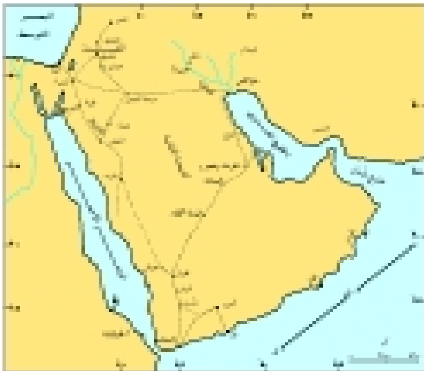
الممالك العربية المتأخرة: الغساسنة والمناذرة وكندة

نائباً عنه في المنطقة. وقيل إن المنذر أسر ولدًا للحارث سنة ٥٥٤م وذبحه قرباناً للعزى، كما أسر الحارث ولدين للمنذر في موقعة أخرى في العام نفسه. وقُتل المنذر قرب قنسرين سنة ٥٥٤م في الموقعة المعروفة لدى العرب بيوم حليمة، وهي ابنة الحارث الثاني ابن جبلة.